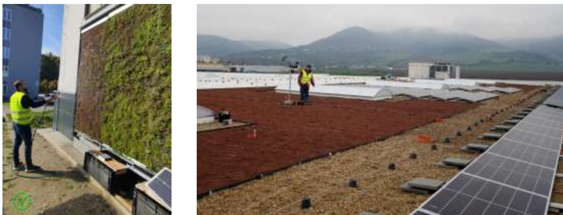
Obr. 1. Dlhodobé merania na zelenej stene SvF a vegetačnej streche priemyselného parku

Veľké množstvo aktivít fakulty bolo v roku 2025 realizované v rámci viacerých výskumných projektov financovaných prostredníctvom grantových agentúr Slovenskej republiky, ktorými sú VEGA, KEGA a APVV. Nemenej významná časť výskumných projektov bola financovaná zo zahraničných grantov alebo zo zdrojov získaných v rámci spolupráce s praxou.