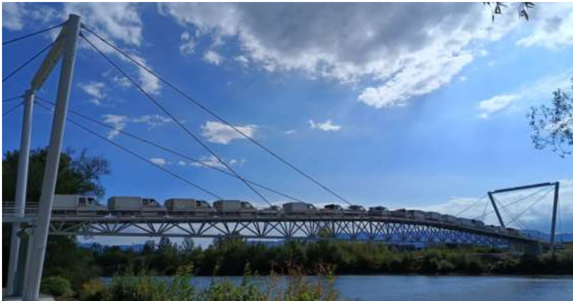
Obr. 2. Statická zaťažovacia skúška najdlhšieho cyklomostu v žilinskom kraji