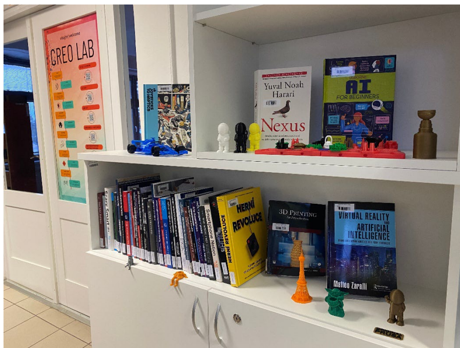
Obr. č. 8 Knižný fond v Creo Labe

V multifunkčnej kreatívnej miestnosti Creo Lab bol založený úplne nový knižný fond, ktorý poteší všetkých fanúšikov technológií a tvorivosti. Možno tu nájsť knihy o umelej inteligencii a jej nástrojoch, virtuálnej realite, 3D tlači, PC a videohrách, pyrografii aj ďalších moderných a kreatívnych témach. Creo Lab sa tak stáva moderným priestorom v knižnici určeným pre študentov – miestom, kde môžu nielen študovať, ale aj pracovať s novými technológiami a niečo nové sa o nich aj dozvedieť. K dispozícii je PlayStation 5 na oddych a herné vzdelávanie, zóny na sústredenú prácu aj 3D tlačiarne na realizáciu vlastných nápadov.