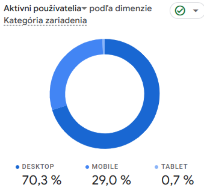
Obr. č. 3 Zariadenia používateľov webovej stránky