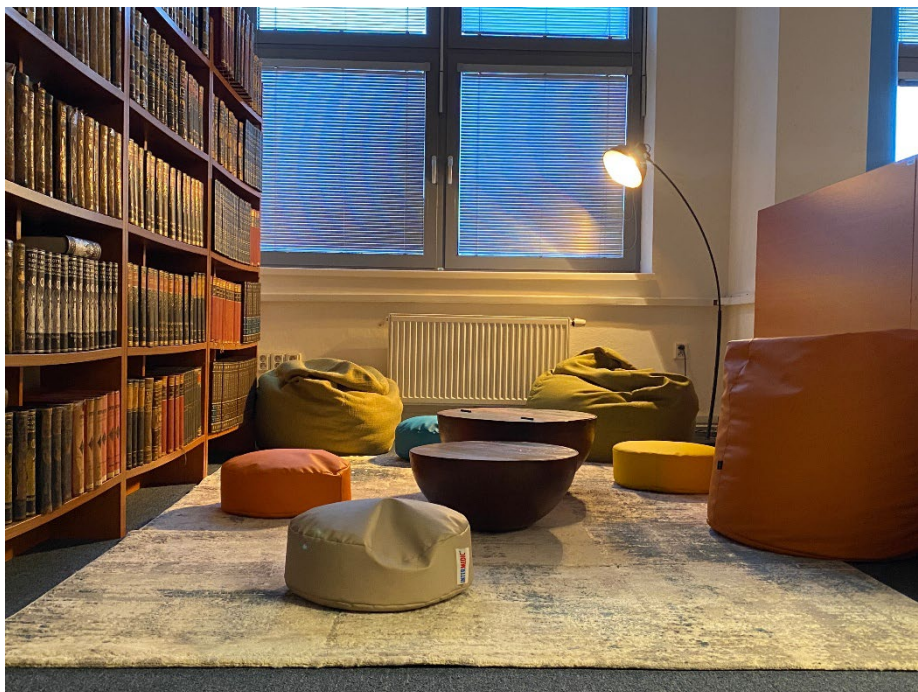
Obr. č. 7 Nová oddychová zóna vo všeobecnej študovni

Druhá oddychová zóna sa nachádza vo Všeobecnej študovni a poskytuje priestor pre oddych a neformálne sedenie na tulivakoch.