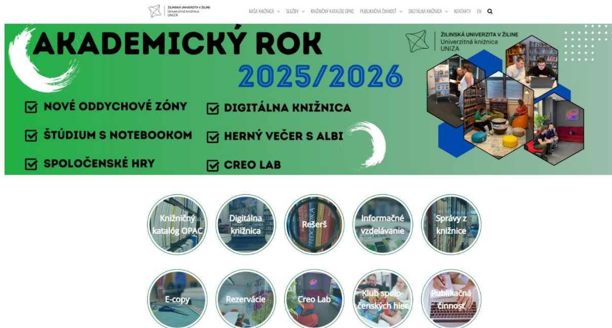
Obr. č. 2 Úvodná stránka webu UK

V roku 2025 sa počet návštev webovej stránky UK zvýšil o 3 % a počet zobrazení stránok klesol o necelé 1 %. Počet unikátnych používateľov vzrástol výrazne o 11 %.