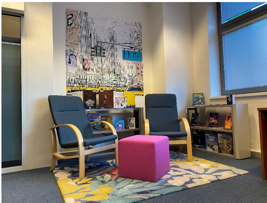
Obr. č. 6 Nový komiksový kútik pre čitateľov

Druhá oddychová zóna sa nachádza vo Všeobecnej študovni a poskytuje priestor pre oddych a neformálne sedenie na tulivakoch.