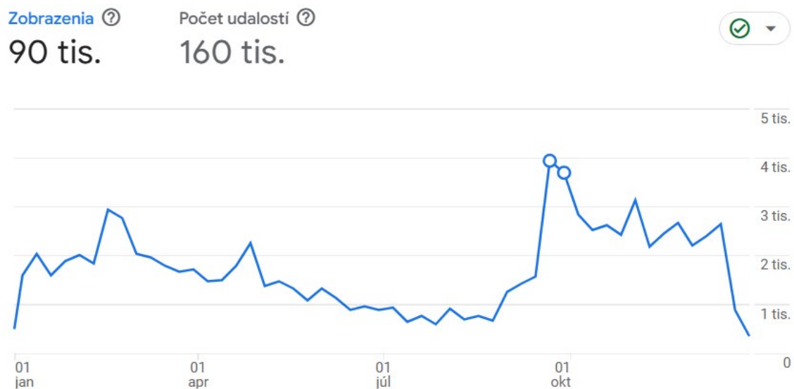
Obr. č. 1 Google Analytics 1. 1. 2025 až 31. 12. 2025

Aj v roku 2025 poskytovala webová stránka UK prehľadný prístup ku knižničnemu fondu, elektronickým zdrojom a databázam, a prinášala aktuálne informácie o službách i podujatiach.