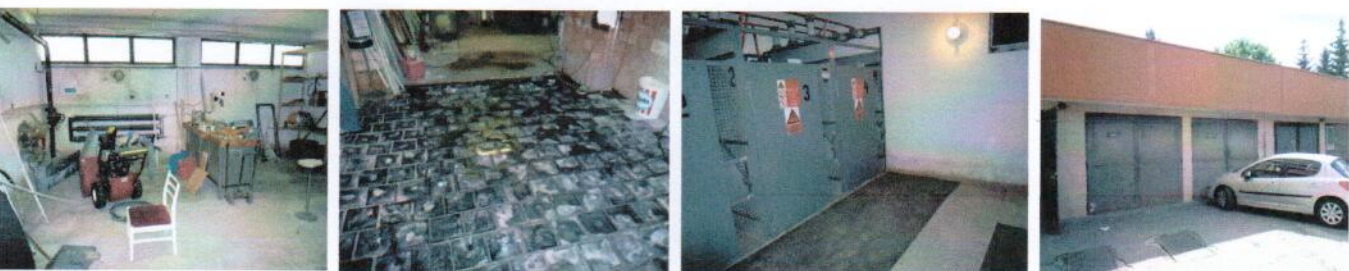
Vnútročné priestory v časti „G“ – dielňa, garáže, sklady a hlavný transformátor.