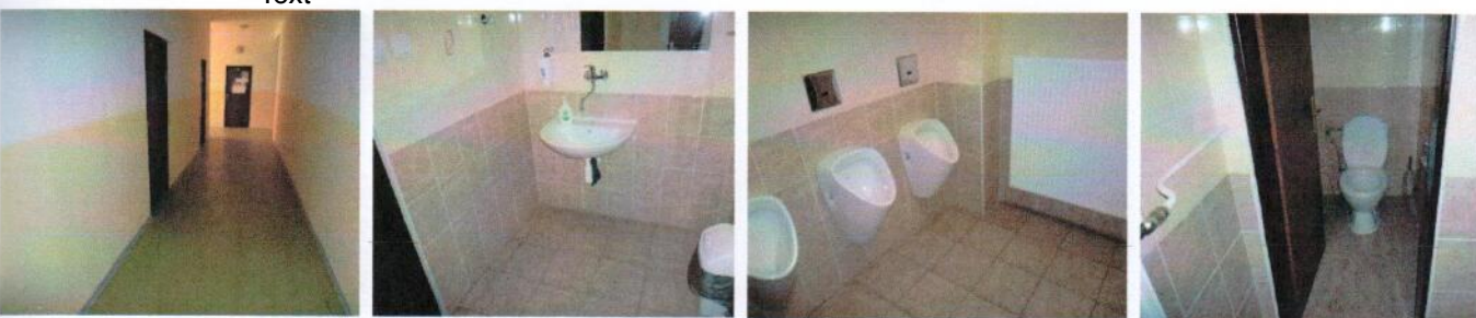
Vnútročné priestory v 1.NP (časť „A“) – chodba, sociálne zariadenia