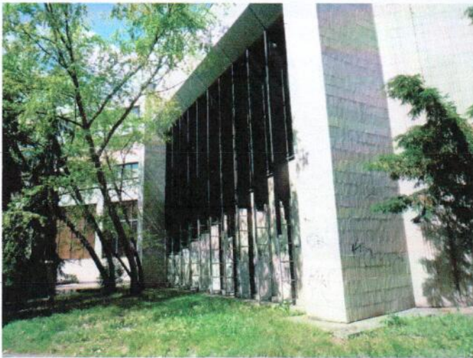
Južný a severný pohľad na objekt „B“