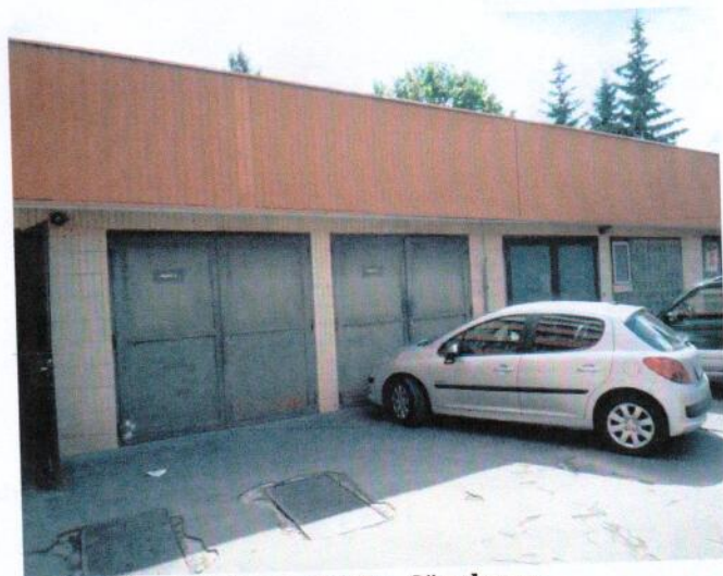
Juhozápadný pohľad na objekt „F“ a severovýchodný pohľady na objekt „G“ z dvora