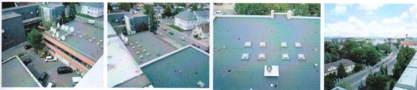
Pohľady na strechy nad časťami objektu „F“ a „G“, pohľad na ul. A Hlinku