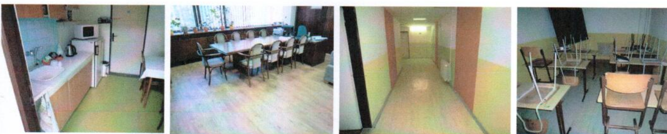
Vnútročné priestory v 2.NP časti „F“ – kuchynka, kancelária, vnútročné priestory v 1.PP časti „F“ – chodba a učebňa