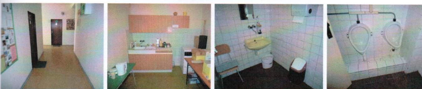
Vnútročné priestory v 3.NP (časť „A“) – chodba, kuchynka, sociálne zariadenia