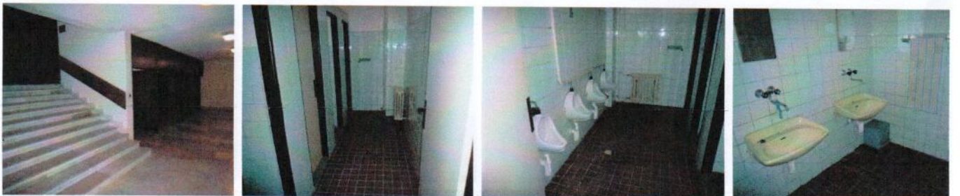
Sociálne zariadenia pri spojovacej chodbe medzi aulami „B“ a „C“