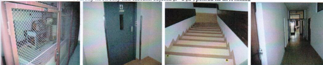
Vnútročné priestory v 4.NP (časť „A“) – výťah, schodisko, spoločná chodba