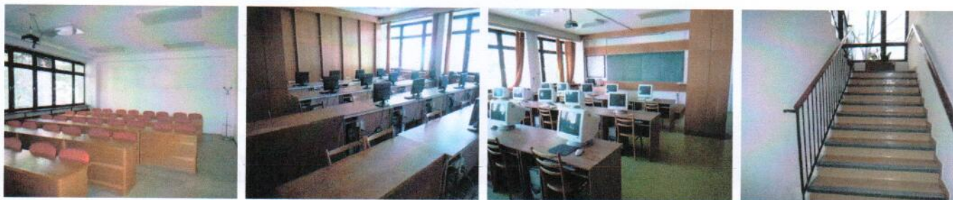
Vnútročné priestory v 1.NP časti „F“ – učebne, schody do 2.NP