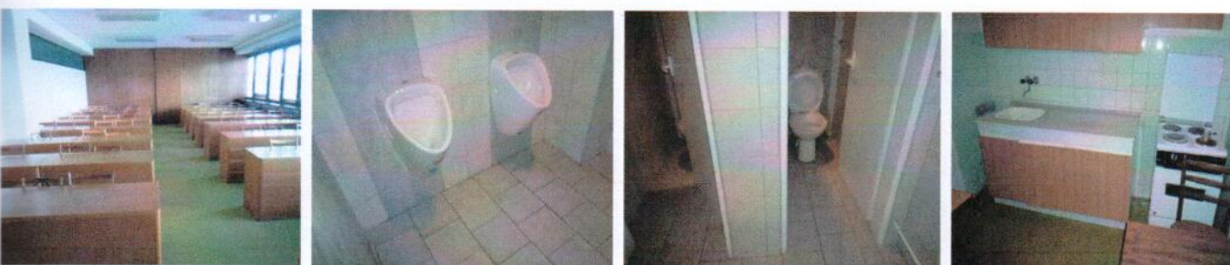
Vnútročné priestory v 2.NP (časť „A“) – učebňa, sociálne zariadenia, kuchynka