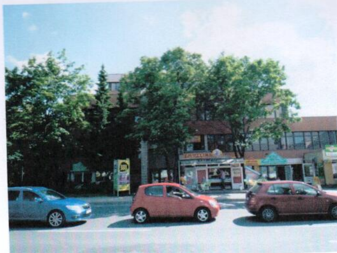
Budova vysokej školy č.s. 727 na parc.KN č.2152, k.ú. Prievidza -východný pohľad na hlavný vstup a severovýchodný pohľad na objekt z ul. A.Hlinku