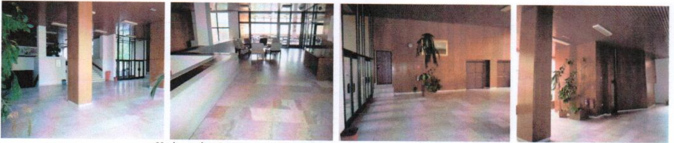
Vnútorne priestory v 1.NP – spojovacie chodba medzi aulami „C“ a „B“