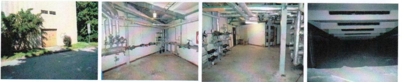
Vnútorne priestory pod aulou časť „B“ – výmenníková stanica