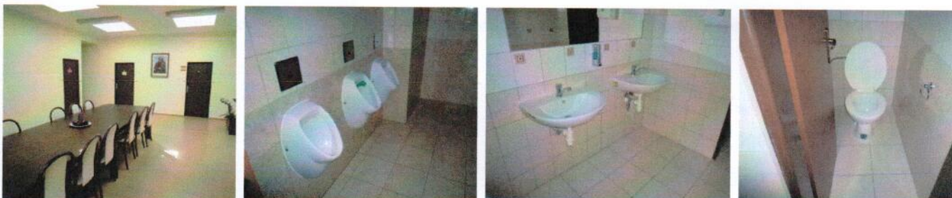
Vnútročné priestory v 2.NP časti „F“ – chodba, sociálne zariadenia