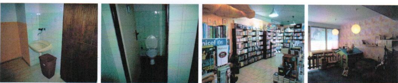
Vnútročné priestory v 1.PP časti „F“ – sociálne zariadenia, predajňa kníh detské denné centrum