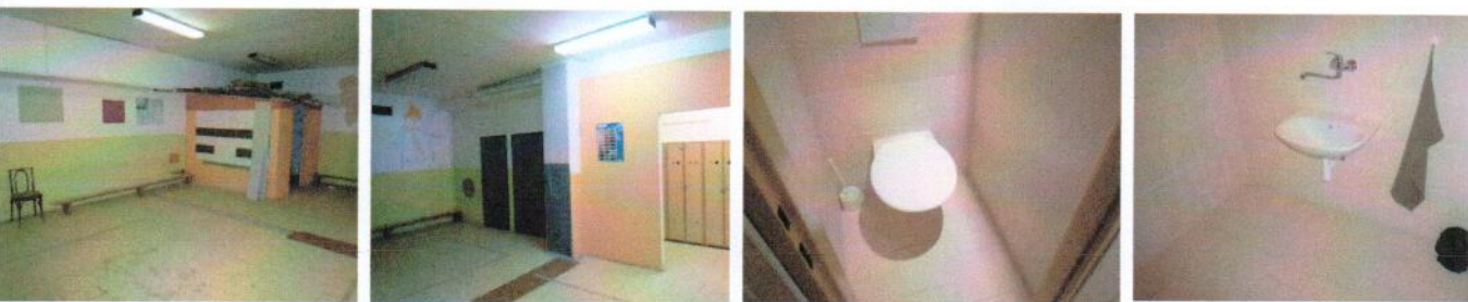
Vnútročné priestory v 1.PP časti „A“ – dielne, sociálne zariadenia