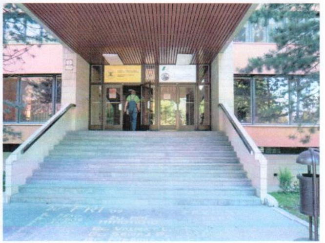
Pohľad na spojovaciu chodbu medzi aulami (objekty „C“ a „B“), hlavný vstup do objektu „A“