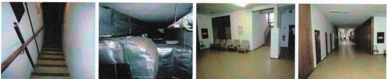
Schody do 1.PP a strojovňa vzduchotechniky v 1.PP pod aulou „C“. Chodba na 1.NP v časti „F“