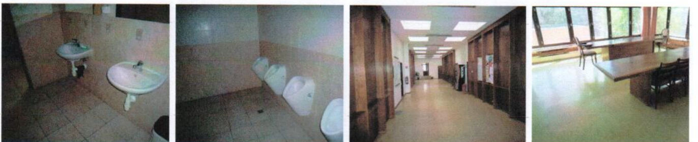
Vnútorne priestory v 1.NP časti „F“ –sociálne zariadenia, chodba a študovňa