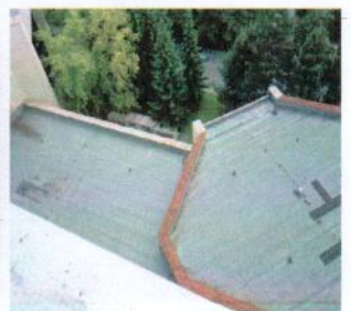
Výťahová šachta na streche objektu „A“, pohľady na strechy nad aulami – „B“ a „C“