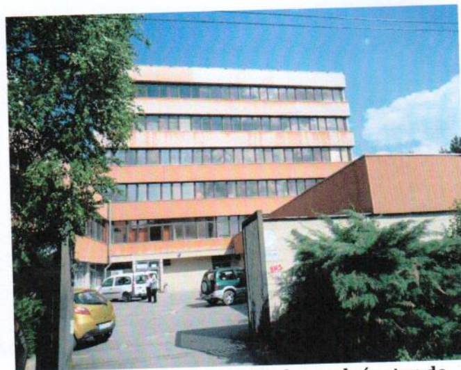
Severozápadný pohľad na objekt z ul. A. Hlinku (v popredí objekt „F“) a západný pohľad na zadný vstup do objektu „A“