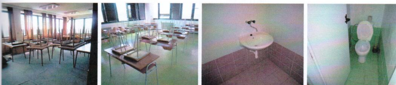
Vnútročné priestory v 4.NP (časť „A“) – učebne, sociálne zariadenia