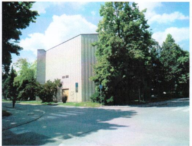
Juhozápadný pohľad na objekty „A“ a „C“, juhovýchodný pohľad na objekt „B“ z ul. Šumperská