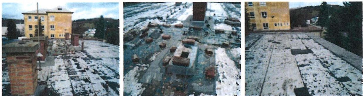
Poškodená a provizórne prikrytá strešná krytina, poškodené niektoré komínové telesá, pôvodná krytina z asfaltových privarovaných pásov