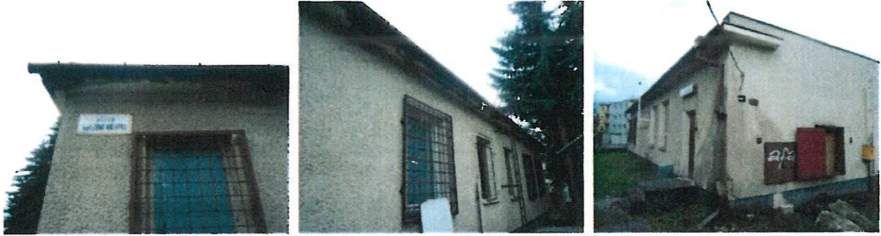
Navlhnuté, poškodené a opadané fasádne omietky