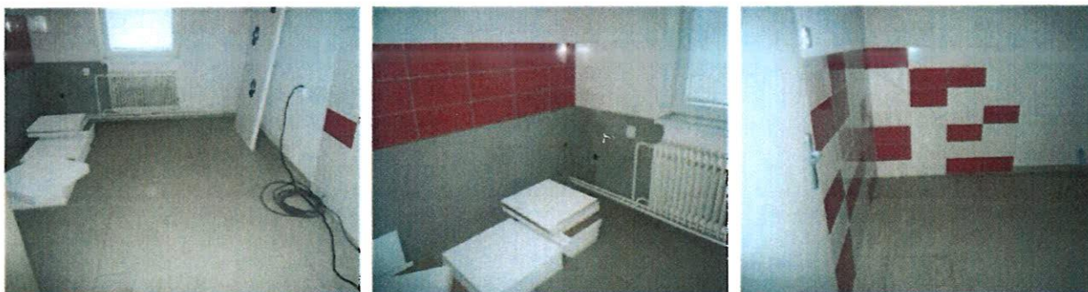
Vnútorne priestory v objekte – pôvodná veterinárna ambulancia