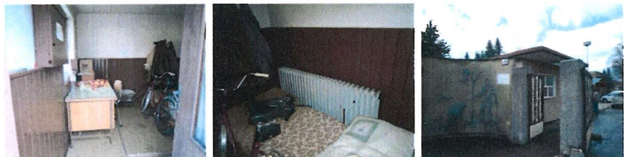
Vnútrotné priestory v objekte