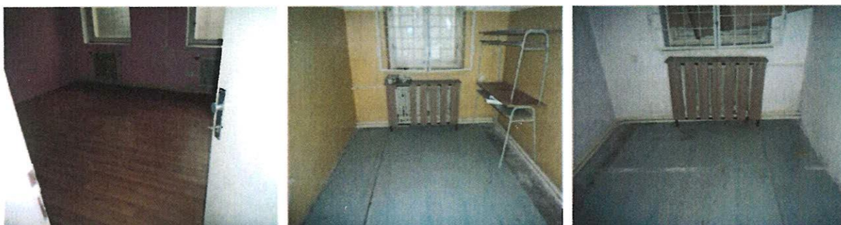
Vnútorne priestory v objekte – kancelárie (sklady)