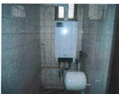
Vnútročné priestory v objekte – spoločná chodba, kotel ÚK