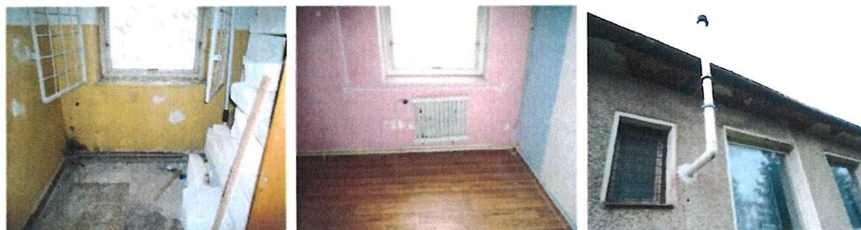
Navlhnuté, poškodené a opadané vnútorné omietky a fasádne omietky na strešnej rímse