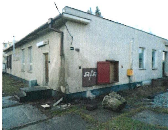
Administratívna budova č.s. 3982 na parc.KN č. 1726/35, k.ú. Liptovský Mikuláš – SV pohľad