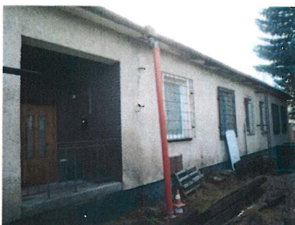
Administratívna budova č.s. 3982 na parc.KN č. 1726/35, k.ú. Liptovský Mikuláš – JV a SZ pohľad