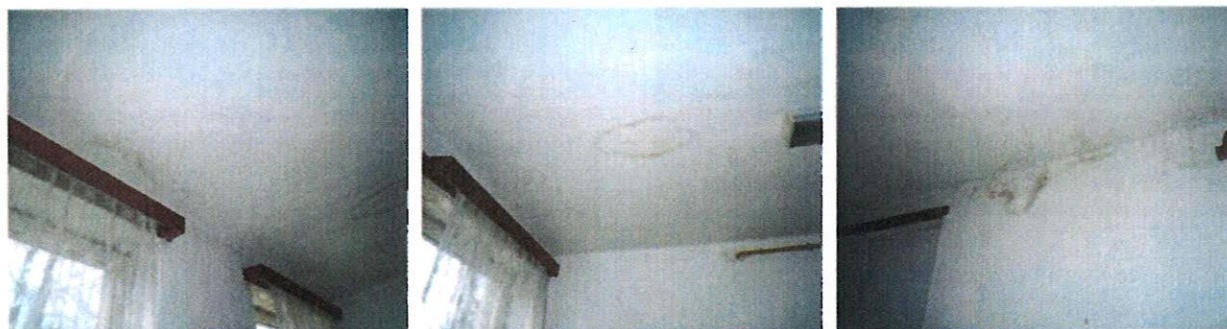
Navlhnuté a zatečené vnútorné omietky