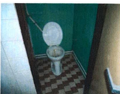
Vnútročné priestory v objekte – zdroj TÚV, sociálne zariadenia