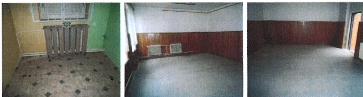
Vnútorne priestory v objekte – kancelárie (sklady)