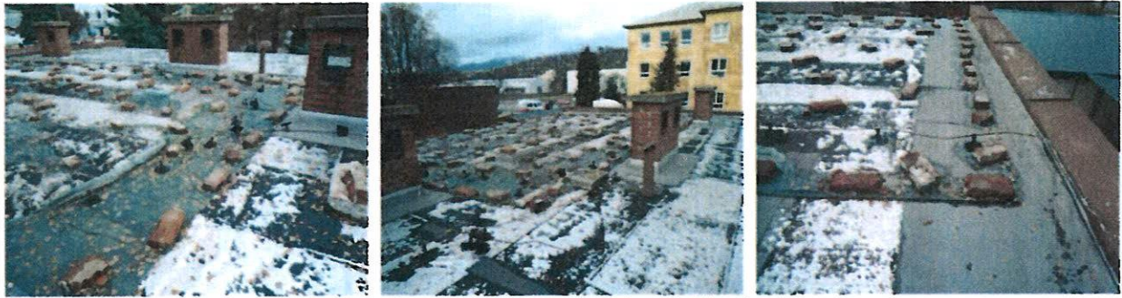
Poškodená a provizórne prikrytá strešná krytina